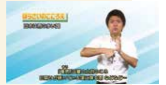
「ぼうさいのころえ」