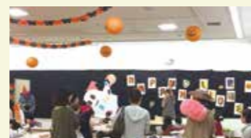
親子で楽しめる全館体感型イベント「ハロウィンおたのしみデー」