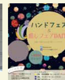
右：市民の“やりたい！”を叶えるイベント「ハンドフェス&癒しフェア DAITO」