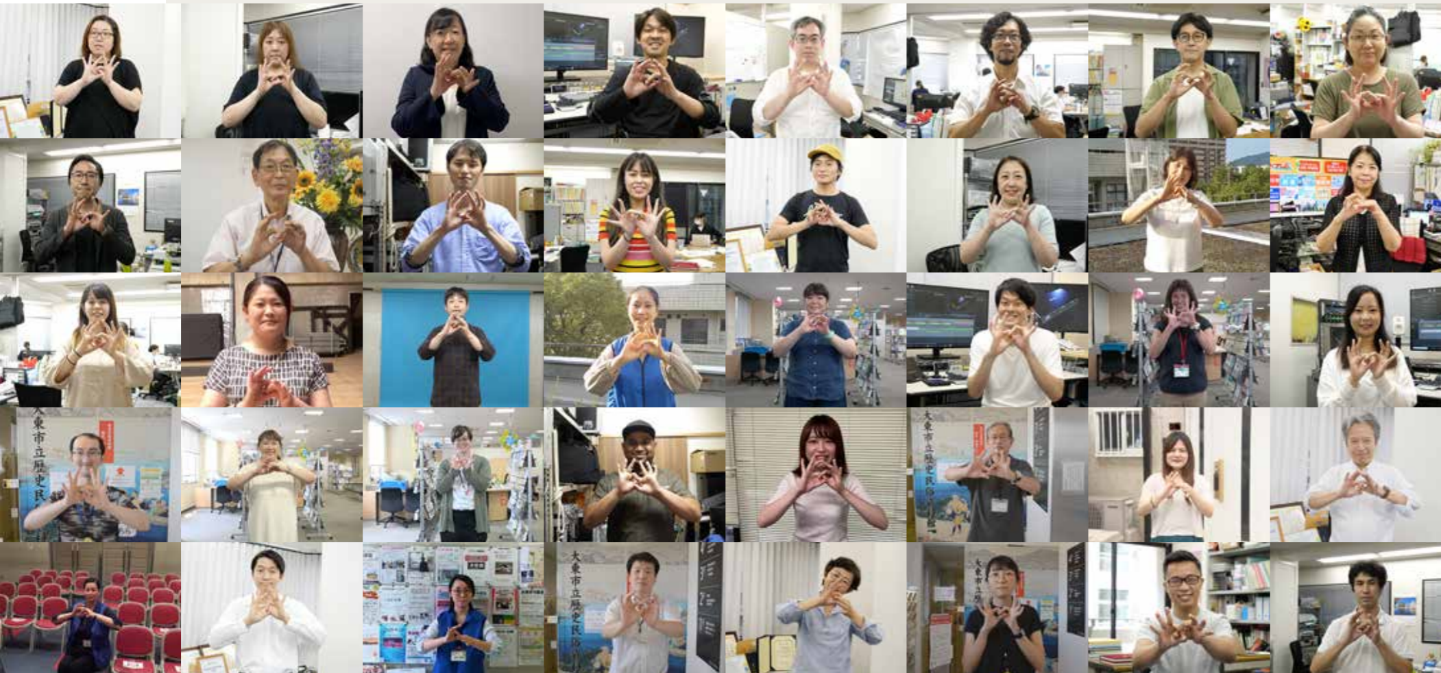
この手話は「つながり」という意味です

アステムに「ガラスの天井」はありません。子育て中でも、病気を抱えていても、できる範囲で管理職を務めている女性が多くいます。「働き方改革」の徹底で、残業ゼロをめざし、より多くの女性が管理職として活躍してほしいと願っています。