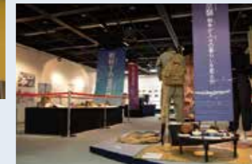
「第36回 平和を考える戦争展」 大阪府富田林市