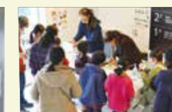
右：資料館主催で毎年開催している子ども対象イベント「れきみんカーニバル」