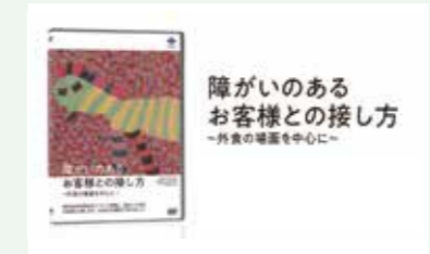
DVD『障がいのあるお客様との接し方～外食の場合を中心に～』

視覚や聴覚に障害のあるひと、高齢などで見えにくい、聞こえにくいひと、外国人などへの情報保障として、映像の内容の音声解説、字幕（日本語・英語など）・手話（日本手話言語・国際手話）を付与して、動画の内容の理解を深めるお手伝いをいたします。