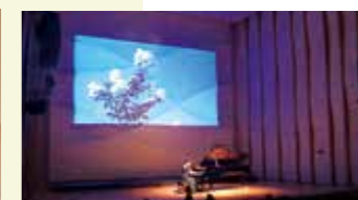
「ピアノでねやがわ散歩」