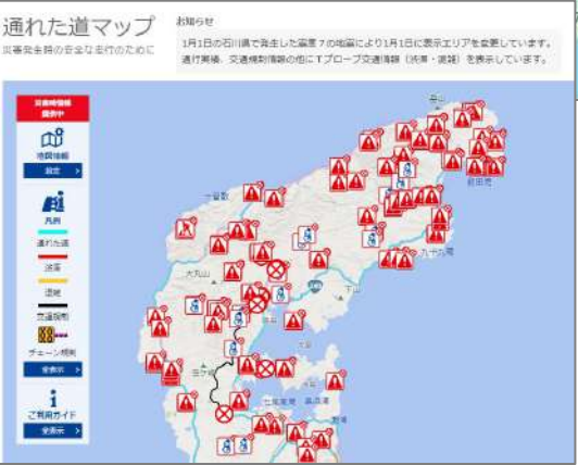
トヨタ発行 通れた道マップ